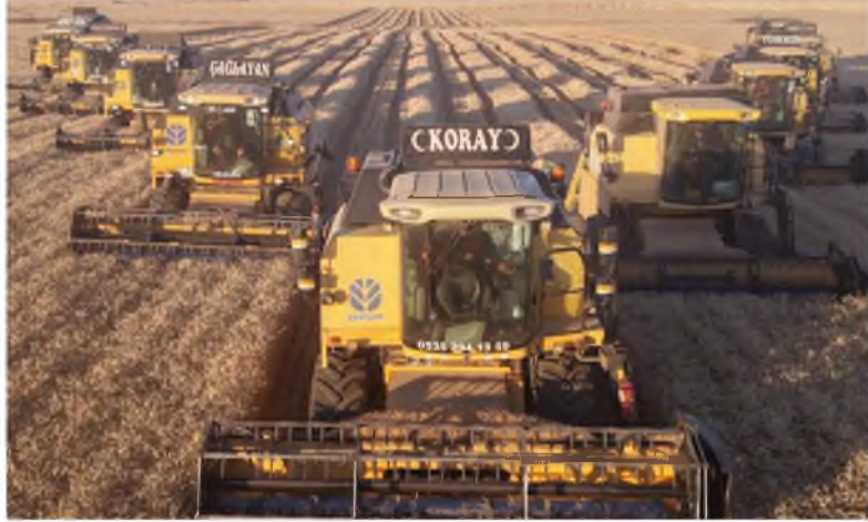
238 biçerdöverle hasat yapılıyor.