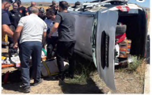
Van'ın Tuşba ilçesinde iki araç