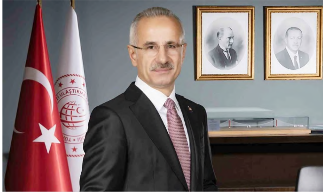
Ulaştırma ve Altyapı Bakanı Abdulkadir Uraloğlu, "Savaşın başından beri Basra Körfezi'nde bulunan Yasa Moon ve Nejat isimli Türk sahipli gemiler" dedi.

21 Haziran sabahı itibarıyla Hürmüz Boğazı'ndan güvenli şekilde çıkış yaptı" dedi.