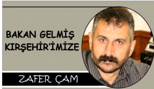
BAKAN GELMİŞ KIRŞEHİR'İMİZE