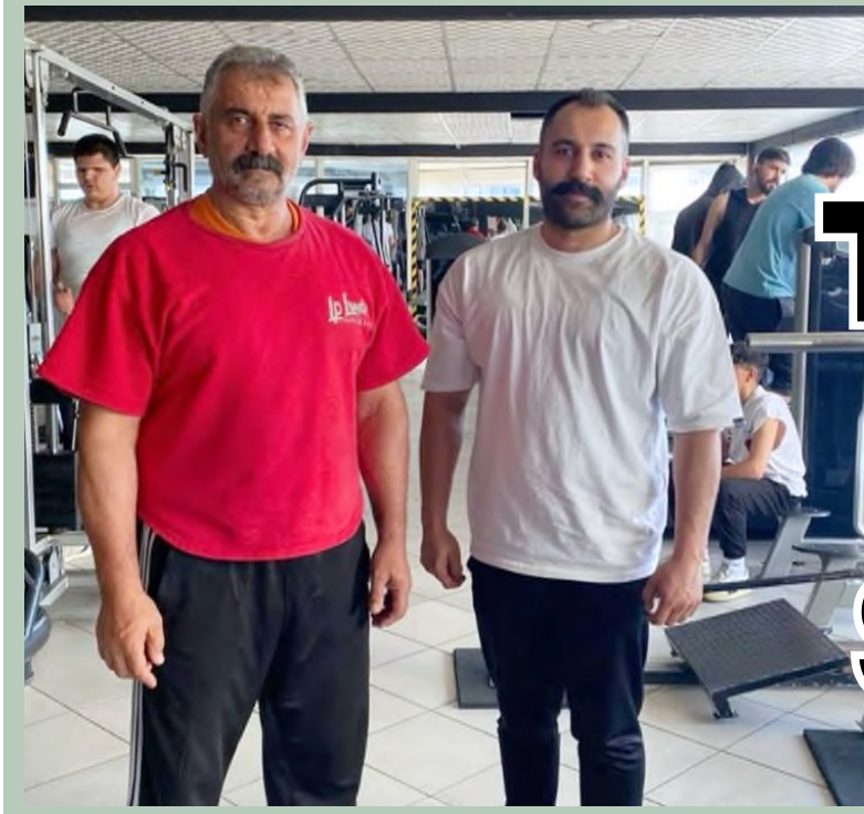
Kırşehir'de 45 yıldır hizmet veren Asr Spor Merkezi, gençleri spora kazandırarak geleceğin sporcularını yetiştirmeye devam ediyor.