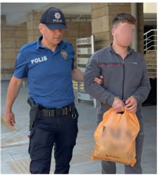
Samsun'un Atakum ilçesinde 'yan bakma' nedeniyle çıktığı iddia edildi.

Bugün Samsun Adliyesi'ne sevk edilen mahkemeye çıkarılan şüphelilerden E.B., çıkarıldığı tarafında tutuklanarak cezaevine gönderilirken, Y.A.P. ise adli kontrol şartıyla serbest bırakıldı. (İHA)