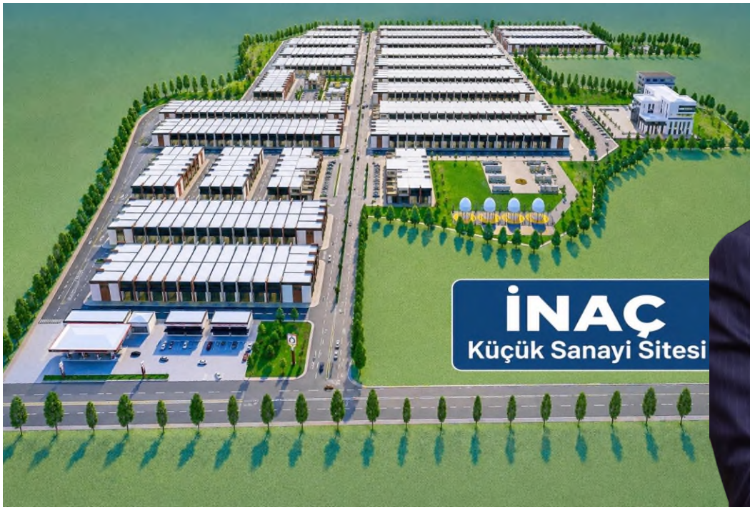
İNAÇ Küçük Sanayi Sitesi