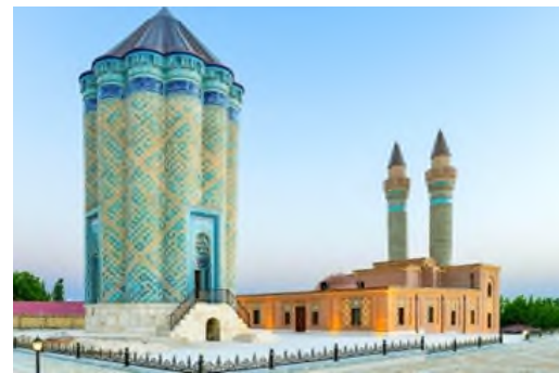
Komplekse dahil olan çift minareler, mimari özelliklerine göre XIII. yüzyıl

Karabağlar türbe kompleksi, Zengezur sıradağlarının eteklerinde, Kengerli rayonunun Karabağlar köyü yakınlarında bulunan bir orta çağ mimari anıttır. Bu kompleks; türbe, çift minare ve aralarında yer alan dini yapının kalıntılarından oluşmaktadır.