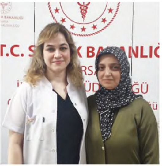
Kilo vermek için başvurduğu Osmangazi Sağlıklı Hayat Merkezi'nde doktor tarafından kanser taraması da

yaptırması tavsiye edilen 44 yaşındaki hastada, erken evrede meme kanseri tespit edildi.