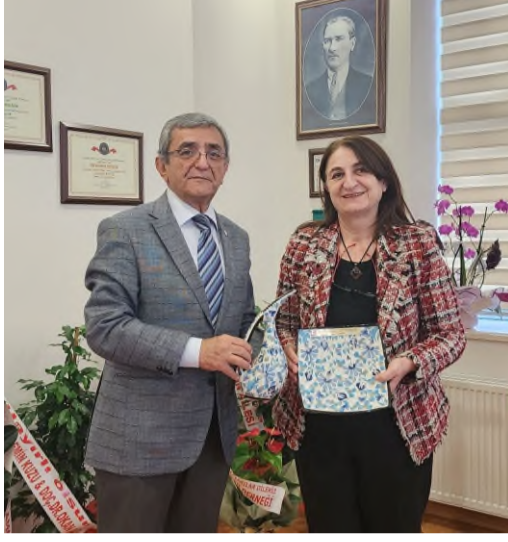
Yeni görevinde başa- rı dilekleri iletilirken, eğitim alanında yürütülecek çalışmalara