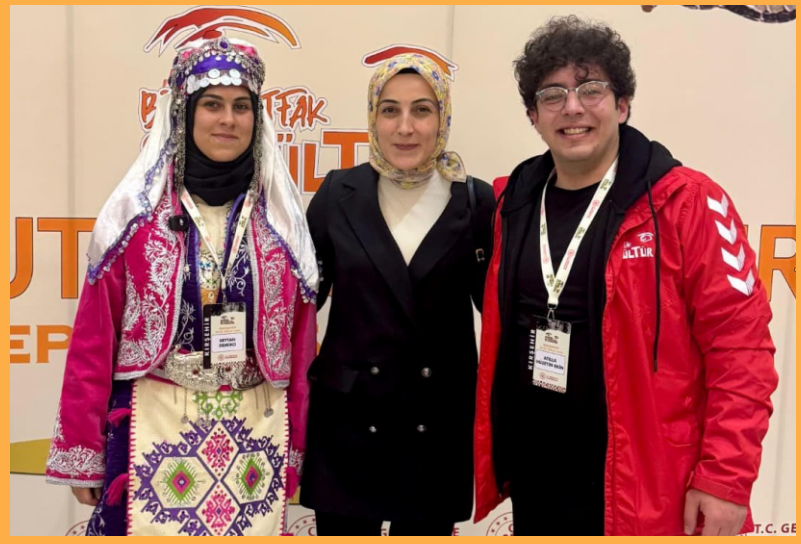
Kırşehir Gençlik ve Spor İl Müdürlüğüne bağlı Cacabey Gençlik Merkezi, 23-26 Aralık tarihleri arasında Gaziantep'te düzenlenen "1 Mutfak 81 Kültür" projesine gönüllü gençlerle katılarak Kırşehir'i başarıyla temsil etti. Devamı 7'de