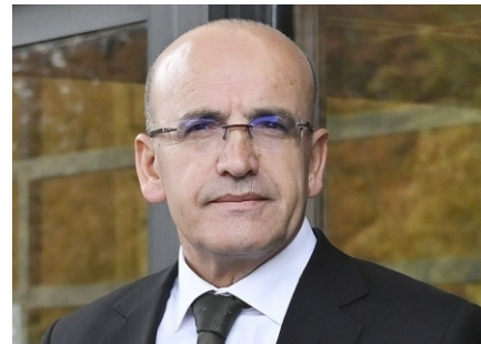
mayı hedefliyoruz." (ANADOLU AJANSI)

Arz yönlü riskleri azaltan ve rekabet gücünü artıran politikaların da katkısıyla fiyat istikrarını sağla-