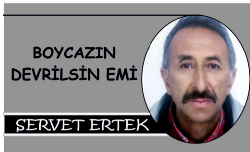
BOYCAZIN DEVRİLSİN EMİ

Kur'an Allahû Teâlânın bize gönderdiği (mektup) İlâhî bir mesâjıdır. Kalpler ancak O'nu anmakla rahat (sükun) bulur. Kur'an dışında %80 din yobazları türü. Bizden uzak olsunlar. Nidecin elin ehli gurubunu hemşerim. Köpeğin sırtı