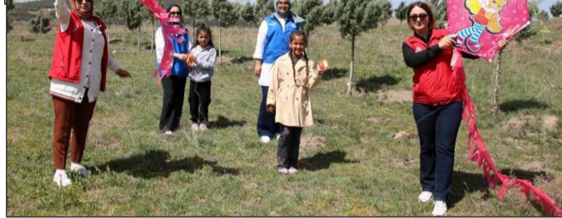
Kırşehir Gençlik Merkezi, 23 Nisan Ulusal Ege-menlik ve Çocuk Bayramı'nın 105. yıl dönümü kapsamında düzenlenen kutlama programına katılarak, çocuklara un-