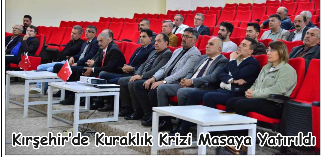
Kırşehir'de Kuraklık Krizi Masaya Yatırıldı