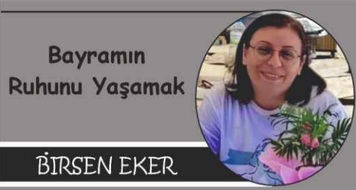
Bayramın Ruhunu Yaşamak

O zamanlar sadece sofralar değil, kalp sofraları da kurulurdu.