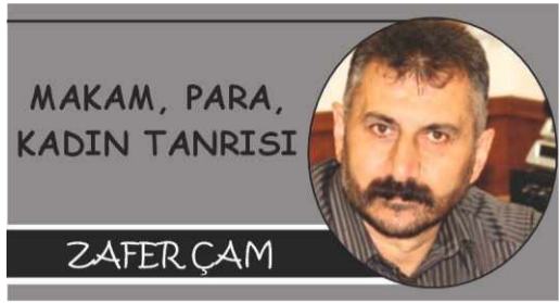
MAKAM, PARA, KADIN TANRISI

Zekât, sadaka ve paylaşma gibi kavramlar unutulmuş, faiz ve haksız kazanç normalleşmiştir.