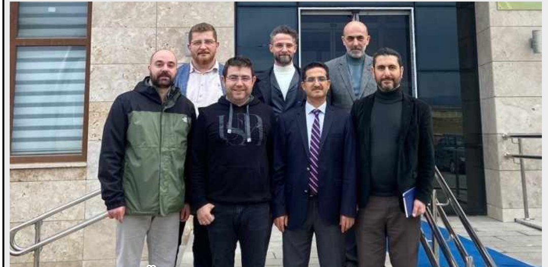
Çorum Hitit Üniversitesi Tıp Fakültesi Heyetinden Kırşehir Ahi Evran Üniversitesi'ne Ziyaret