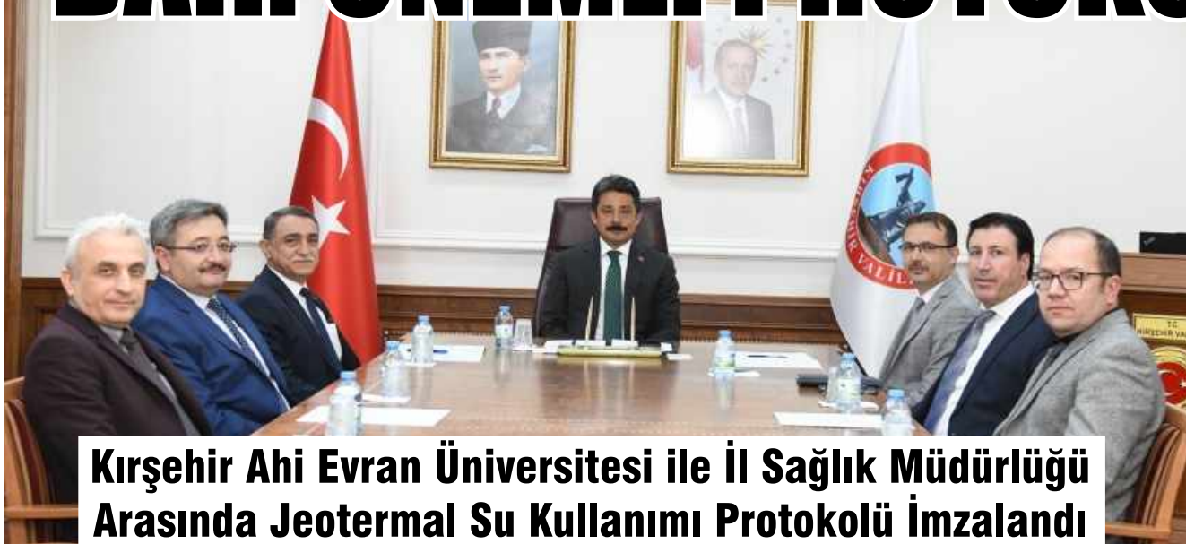
Kırşehir Ahi Evran Üniversitesi ile İl Sağlık Müdürlüğü Arasında Jeotermal Su Kullanımı Protokolü İmzalandı