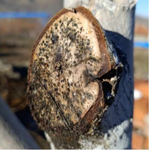
Kırşehir Tarım ve Orman İl Müdürlüğü, ilçe müdürlüklerinin saha ça-

Kırşehir Tarım ve Orman İl Müdürlüğü yetkilileri, tarımsal üretimde kalite ve verimi artırmaya yönelik çalışmaların devam edeceğini belirterek, üreticilere yönelik saha eğitimlerinin süreceğini açıkladı. (ÜMMÜGÜLSÜM EROĞLU)