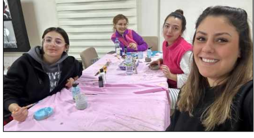
Kırşehir Gençlik ve Spor İl Müdürlüğü'ne bağlı Gençlik Merkezi,

yurtlarda konaklayan gençlerin sosyal, kültürel ve sanatsal gelişimine katkı sağlamak amacıyla düzenlediği kulüp ve atölye faaliyetlerine hız kesmeden devam ediyor. Gençlerin