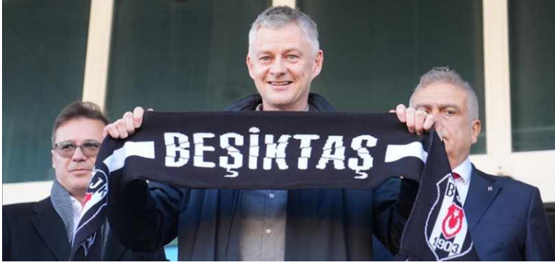
Solskjaer'i taşıyan uçak, saat 14.30 sularında Atatürk Havalimanı Genel Havacılık Terminali'ne indi.

Norveçli teknik adamı, havalimanında Beşiktaş Kulü-