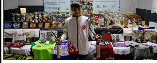
Tenis oynayan abisinden etkilenerek spora başlayan

14 yaşındaki Bulut, ulusal ve uluslararası turnuvalarda çeşitli