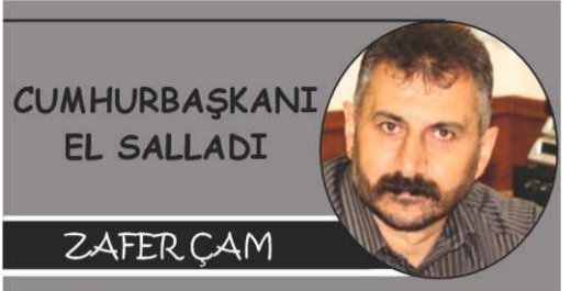
CUMHURBAŞKANI EL SALLADI