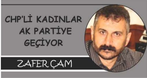
CHP'Lİ KADINLAR AK PARTİYE GEÇİYOR

Farklı siyasi görüşler, ideolojiler veya çıkar grupları arasındaki çatışmalar-