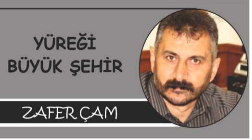
YÜREĞİ BÜYÜK ŞEHİR