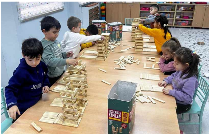
Kırşehir Gençlik ve Spor İl Müdürlüğü bünyesinde faaliyetlerini sürdüren Kırşehir Gençlik Merkezi,

kulüp ve atölye çalışmalarında geleceğin zihinlerini geliştirmeye yönelik anlamlı bir projeye imza atıyor.