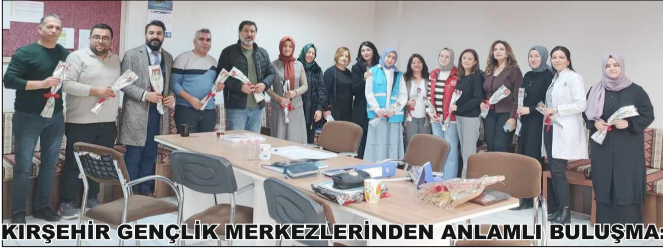
KIRŞEHİR GENÇLİK MERKEZLERİNDEN ANLAMLI BULUŞMA: