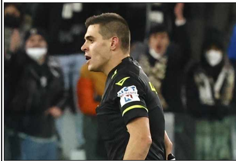
UEFA'dan yapılan açıklamaya göre, Macaristan'ın

Debrecen kentindeki Nagyerdei Stadi'nda TSİ 20.45'te başladı müsabakada Sozza'nın yardımcılıklarını vatandaşları Alberto Tegoni ile Giovanni Baccini üstlenecek.