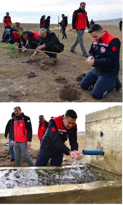
Kırşehir İl Tarım ve Orman Müdürlüğü, mera islah ve amenajman pro-