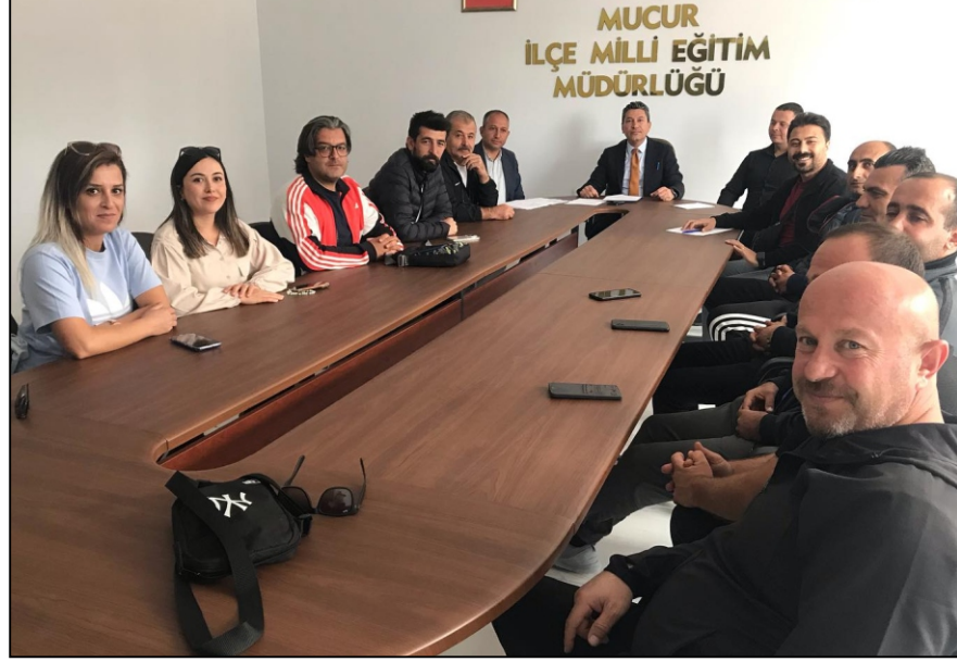
MUCUR İLÇE MİLLİ EĞİTİM MÜDÜRLÜĞÜ

Mucur İlçe Milli Eğitim Müdürlüğü, 2024-2025 eğitim öğretim yılında ilçede gerçekleştirilecek sosyal, kültürel ve sportif faaliyetler için öğretmenlerle bir araya geldi.