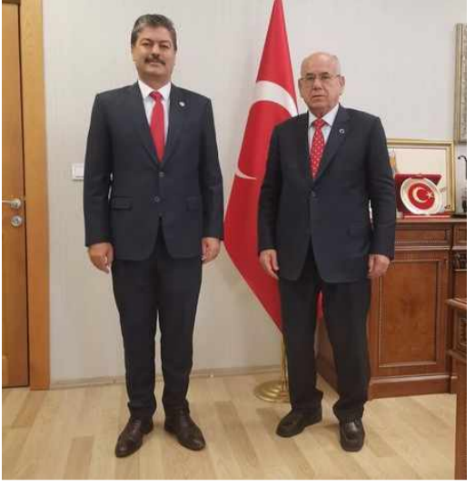
AK Parti Kırşehir Milletvekili Nec-