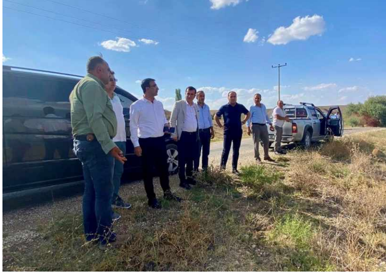
Kırşehir İl Genel Meclis Başkanı Bülent Ozan, Çiçekdağı ilçesine bağlı Kızılca, Kabaklı, Gölçük, Bozlaevci ve Acı köylerinde yapılan alan incelemeleri ve arazi kontrolleri