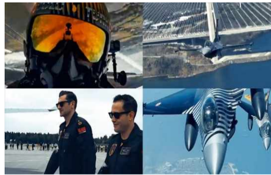
hareketlerinin görüntülerine yer verildi.

SOLOTÜRK'ün sosyal medya hesabında "İstanbul" başlığıyla yer alan paylaşımında da F-16 uçağıyla yapılan akrobasi