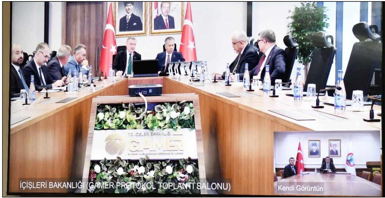
İÇİŞLERİ BAKANLIĞI (GAMER PROTOKOL TOPLANTI SALONU)