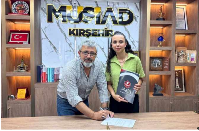
Kırşehir'de faaliyet gösteren özel eğitim kurumlarından Alfa Eğitim Kurumları ile MÜSİAD Kır-

Alfa Eğitim Kurumları ve MÜSİAD Kırşehir'in bu iş birliği, Kırşehir'deki eğitim sektörüne yeni bir ivme kazandırma amaçlarken, gelecekte de benzer iş birliklerinin devam edeceği sinyallerini verdi. (FİLİZ ÖZ)