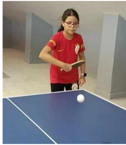
Yaz kursları kapsamında sunulan çeşitli spor aktiviteleri arasında-

Kırşehir'in mucur ilçesindeki Gençlik ve Spor İlçe Müdürlüğü, çocuklar ve gençler için düzenlediği Yaz Okulları programıyla dikkat çekiyor.