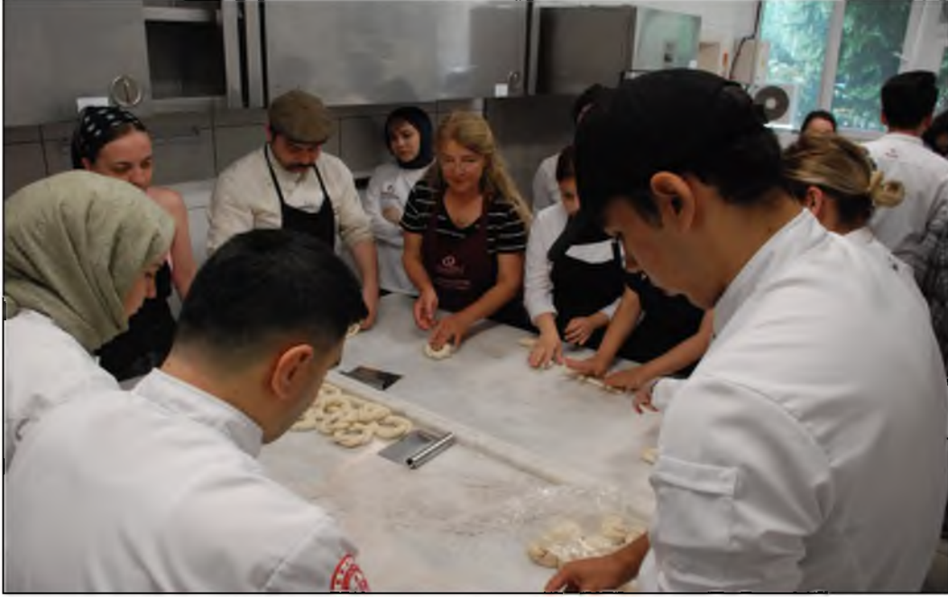
Eskişehir'de, etkinlikleri kapsamında Anadolu Üniversitesi Turizm Fakültesi Gastronomi Bölümü öğrencileri-ne coğrafi işaret tes-

cilli Eskişehir simidinin yapımının öğretildiği atölye etkinliği düzenlendi.